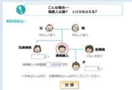
相続人は誰?いくらもらえる? (図1)